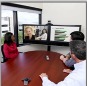
Gruppensystem für Konferenzräume